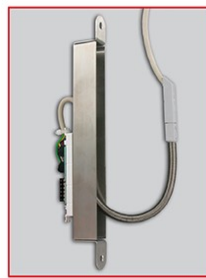
M 13 55

Für alle Miniatur-Kabelübergänge von LINK steht auch Zubehör zur Verfügung. Zum Beispiel Abdeckbleche für Holz- und Kunststoff-/Aluminiumrahmen. Zudem sind Aufnahmekästen für die Feder separat erhältlich.