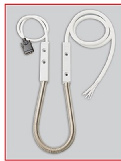
M 13 40

Die Variante M 13 40 eignet sich als perfekte Lösung für einen Alarmglasanschluss, zum Beispiel in Terrassentüren. Der M 13 55 wiederum verfügt über einen Aufnahmekasten für die Feder, auf dessen Rückseite eine Platine mit Schraubklemmen angebracht ist. Dort lassen sich variabel Komponenten anschließen, je nach Kundenbedarf. Diese Kästen werden bei der Fenster- bzw. Türenproduktion vorinstalliert. Auf der Baustelle müssen dann nur noch die entsprechenden Kabel angeschlossen werden.